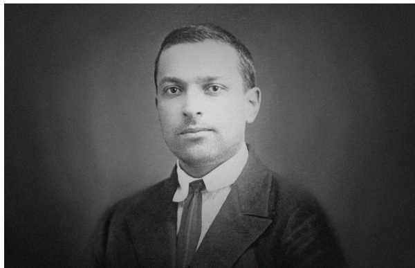
Приложение 1. Выготский Лев Семёнович. 1930-е